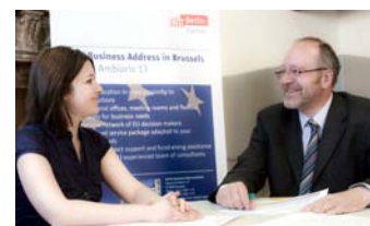
Mit einem umfangreichen Beratungsangebot ist Berlin Partner in Brüssel vertreten.